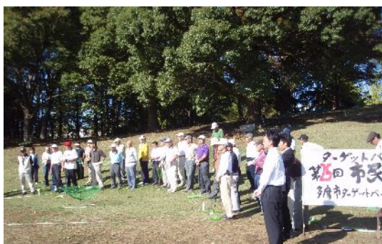
来賓の挨拶を聞く参加者