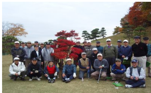
紅葉をバックにパチリ！